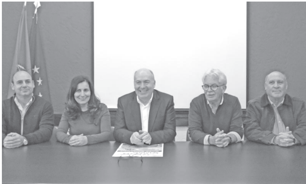
A Junta de Freguesia quer manter a memória e tradição do Natal Beirão