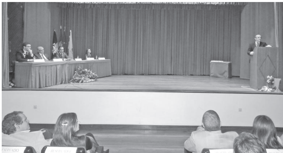
A cerimónia foi presidida pelo secretário de Estado João Sobrinho Teixeira

Sobrinho Teixeira considera que “a rede de Ensino Superior em Portugal é, por ventura, o maior património de obra do pós-25 de Abril” e, nesse sentido, aplaudiu “o valor da ESGIN que lhe permite ter uma grande pujança e encontrar oportu-