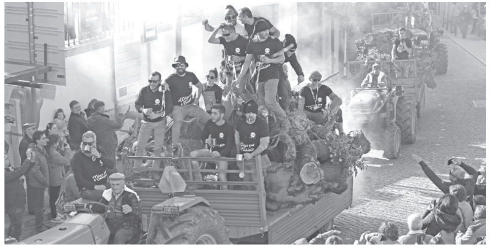
Foram mais de 20 os tratores que trouxeram os madeiros para alimentar a fogueira

Desde dia 7 que a Vila Madeiro está em festa, com muita música e outras atividades dirigidas a todas as idades