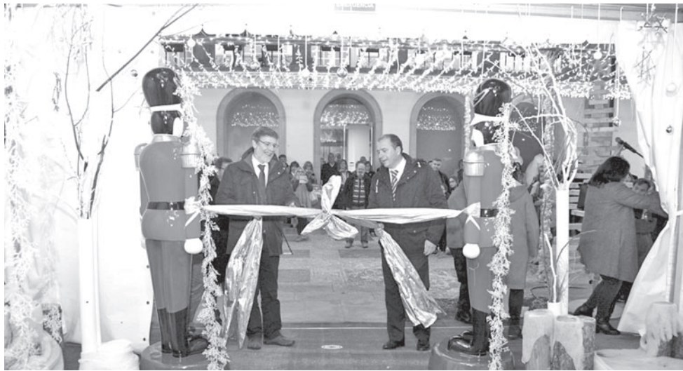
O Natal Branco foi inaugurado dia 7 de Dezembro e continua até dia 6 de janeiro