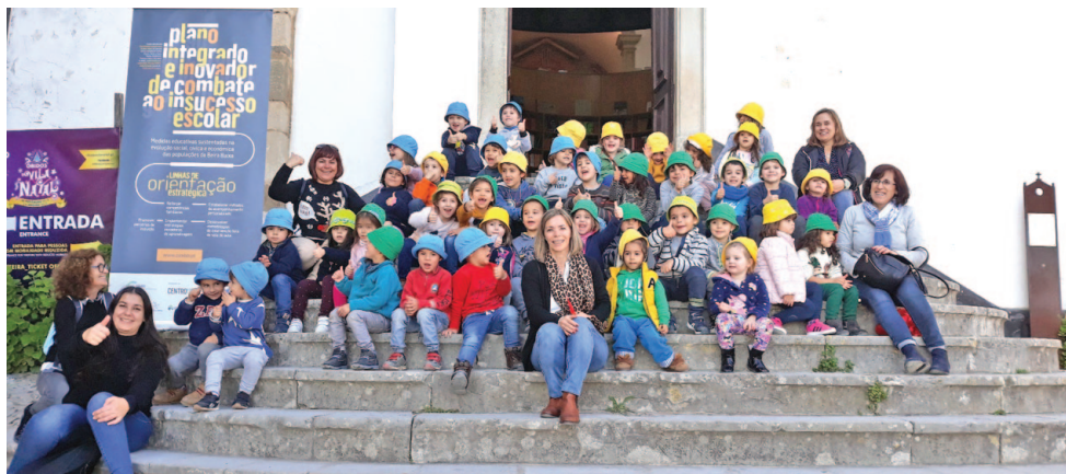
As crianças tiveram a oportunidade de se encantar com a Vila Natal de Óbidos

A iniciativa apoiada pela Câmara fez com que as crianças tivessem um dia diferente com aprendizagens diversificadas