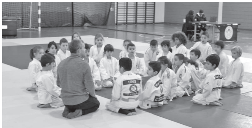
73 atletas do Distrito competiram num ambiente de saudável competitividade

Judocas do seis aos 12 anos competiram num torneio que serviu também para desenvolver o espírito de amizade e entreajuda