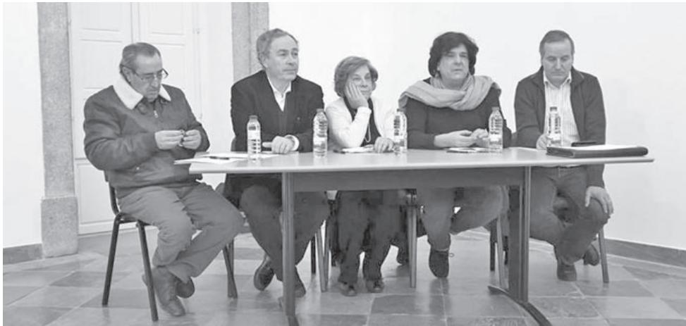
O colóquio foi organizado pela Sociedade de Amigos do Museu

Tavares Proença Júnior: Que caminhos, que futuro? , realizado dia 4 de dezembro, pela sua Sociedade de Amigos do Museu.